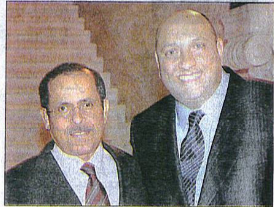
سفير الامارات العربية سيف مبارك العرياني وباسكال دوفالبيير

قام رئيس جامعة السوربون الفرنسية العريقة البروفسور جان - روبرت بيت بتقليد المستشار المعروف في العلاقات الدولية لباسكال رونوار دوفالبيير وسام الاستحقاق الوطني الفرنسي من رتبة فارس، باسم الرئيس نيكولا ساركوزي، وذلك تقديرا للدور الذي لعبه في إنشاء فرع جامعة السوربون في أبو ظبي. وحضر الحفل الذي اقيم في باريس نواب فرنسيون وشخصيات اكاديمية مرموقة معنية بالانتشار العلمي والثقافي الفرنسي في العالم. وتلقت كلمات شددت على نوعية الانجاز الذي قام به دوفالبيير في دولة الامارات، بحيث ان «سوربون أبو ظبي» التي بدأت عامها الثاني في تشرين الاول الماضي، بـ ٢٥٠ طالبا من جنسيات عديدة، تتوقع اقبالا قد يتجاوز الالف طالب نظرا للنوعية العالية في برامجها وابعاد دروسها في الانسانيات.