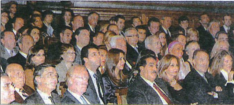
جانب من الحضور في الحفل