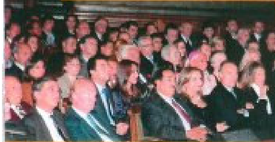
في مقدمة الحضور من اليمين إلى اليسار كارولين شوفلي، وزير الدولة رينو ديتروي، الدكتور حمزة الخولي، الوزير هوتوهور وزير الهجرة والأندماج ووزير الخارجية السابق هيلين دوست بلاري