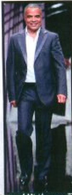
«الحالة» تتوج بوييله الفضي

17 - 19 كانون الأول (ديسمبر) 2007 العدد 1701 السعر 3000 ل.ل.