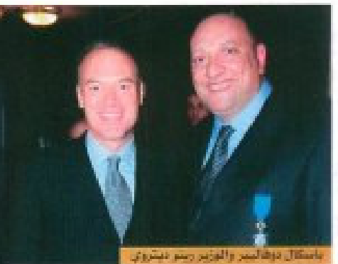
باسكال دوفالبيير والوزير رينو ديتروي