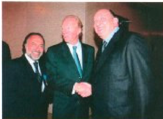
باسكال دوفالبيير والوزير برنيس هوتوهور وأوليفييه داسو